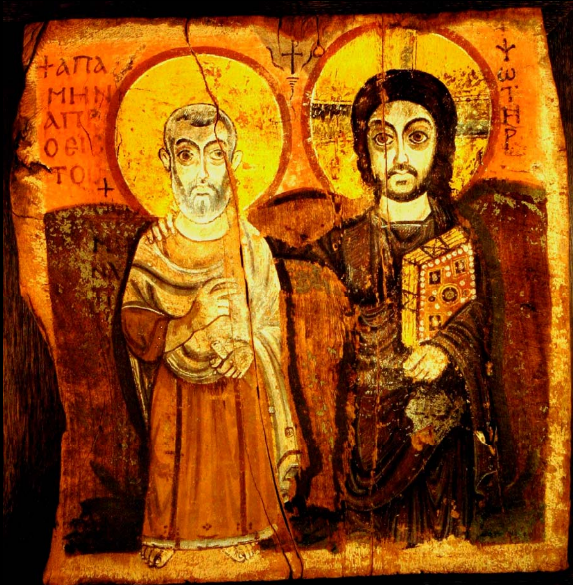
Icona dell'amicizia, scuola copta, VI sec.