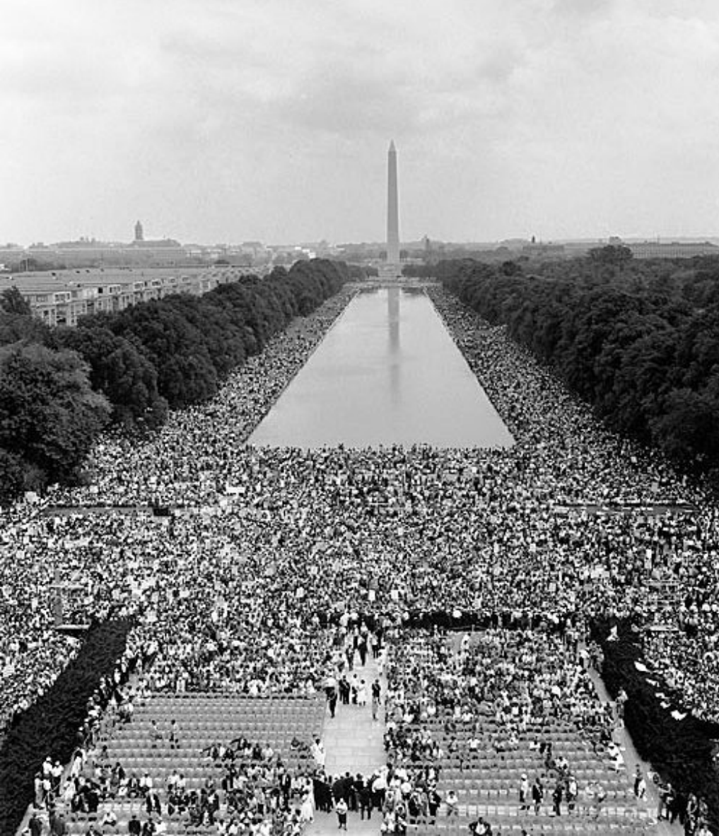
Vista dal Lincoln Memorial verso il Washington Monument, il 28/8/1963

Io ho un sogno, che i miei quattro figli piccoli vivranno un giorno in una nazione nella quale non saranno giudicati per il colore della loro pelle, ma per le qualità del loro carattere. Ho un sogno, oggi!