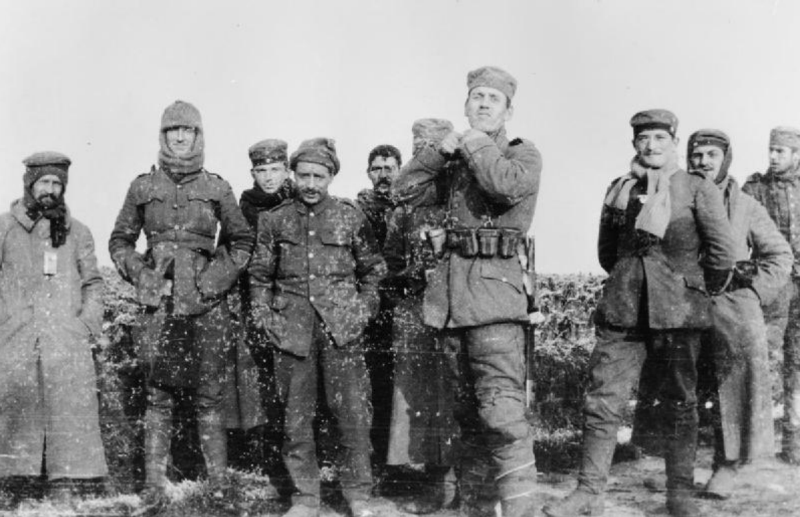
Fraternizzazione sul fronte delle Fiandre. Natale 1914