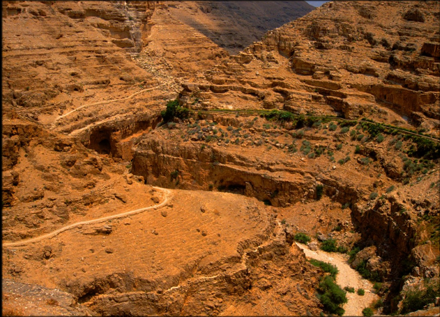
Da Gerico a Gerusalemme - Wadi Qelt