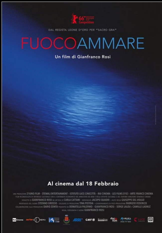
Fuocoammare – documentario 2016

Gianfranco Rosi ha gli stessi luoghi nei suoi documentari