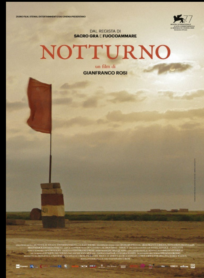
Notturmo – documentario 2020