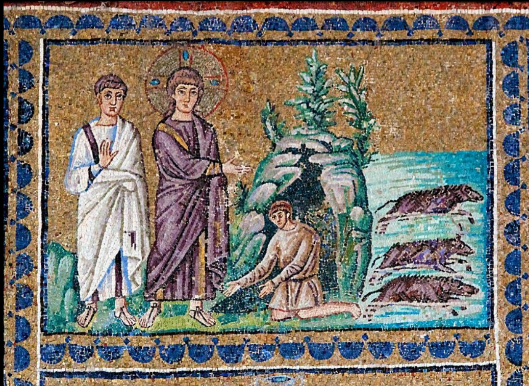
Mosaico parietale S. Apollinare nuovo - Ravenna